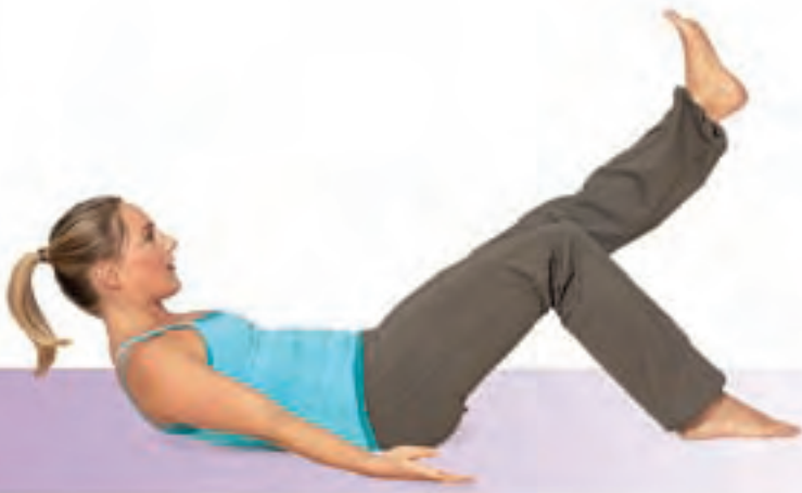
Abb. 3: Curl-up & Bicycle in Air

leicht gebeugt. Schiebe den Scheitel nach oben, um die Wirbelsäule aufzurichten.